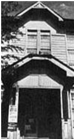
▲ 旧竹原書院 (現竹原市歴史民俗資料館)