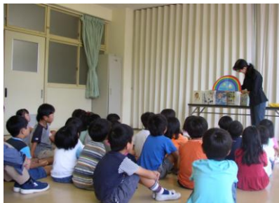
ブックトーク … 忠海西小学校にて

市立竹原書院図書館 竹原市中央4丁目7番11号 TEL 22-0778 FAX 22-1072