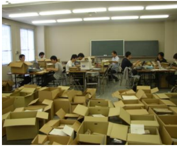
▲広大の皆さんによる古文書整理の様子

市立竹原書院図書館 竹原市中央4丁目7番11号 TEL 22-0778 FAX 22-1072