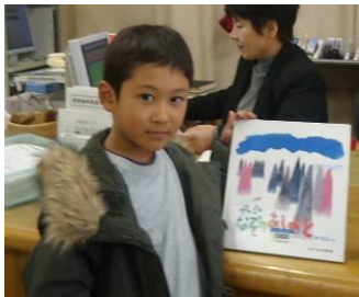
現在ダントツ1位！ 忠西1年かついたかきくん

あと二カ月の読書マラソンです。今からでも遅くありません。ラストスパートをかけて、親子で図書館通いをしてください。親子の思い出づくりにもなることでしょう。尚、読書マラソンは、三位までの人を表彰しようと、準備しています。