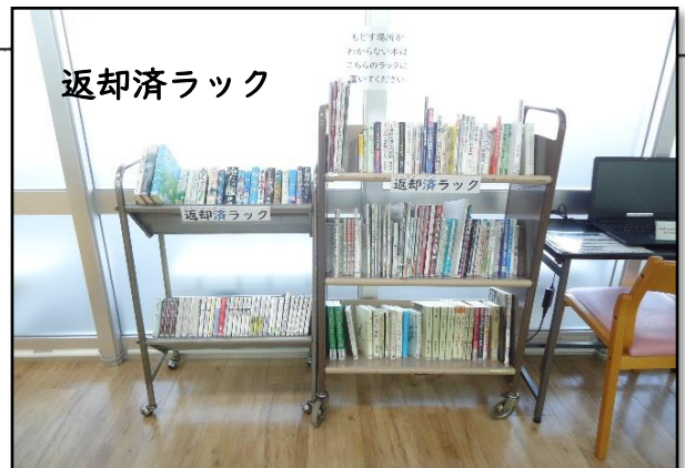
返却済みラックは児童コーナーにもあります