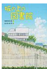
池田 ゆみる作 さ・え・ら書房