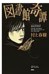
村上 春樹著 新潮社